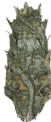
Nakrycie głowy Irati

Komplet maskujący IRATI daje niezauważalność w terenie. Wykonany jest z elastycznego, rozciągliwego materiału , bardzo lekki niekrępujący ruchów. Składa się z trzech części: bluzy, spodni i nakrycia głowy. Na zewnątrz są naszyte liście na przewiewnej siateczce , jest w kolorze camo, w odcieniach zieleni, brązu.